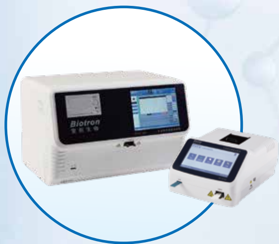
配套仪器：干式荧光免疫分析仪