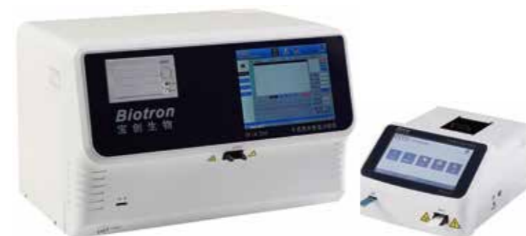
配套仪器：干式荧光免疫分析仪